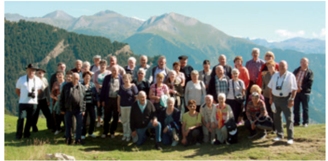
Au col de la Botella en Andorre

Activités 2015 : l'assemblée générale se tiendra le 20 janvier et le quine le 22 février. Une sortie au printemps est à l'étude ainsi que le voyage d'automne. Et bien entendu, les activités ludiques