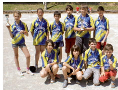
Des jeunes médaillés

meilleure image possible de notre commune à ces nombreux visiteurs.