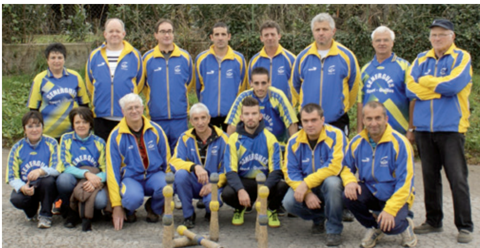
La section Quilles au Maillet