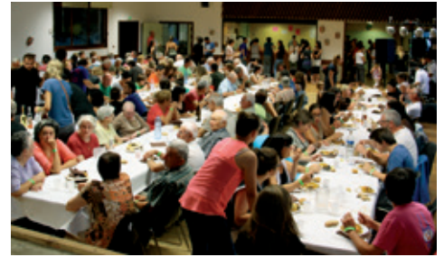
La paëlla géante