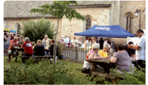
Le marché gourmand