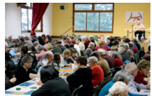
Quine janvier 2014