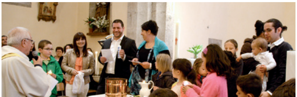
Baptême Pâques 2014

Du côté des célébrations : les célébrations dominicales sont préparées par une équipe liturgique qui prend cette tâche avec sérieux. Les célébrations des sépultures sont maintenant conduites par des laïcs mandatés