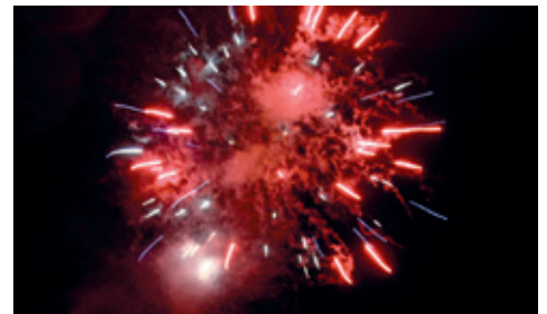
Le feu d'artifice