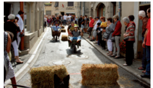
Les premiers jeux Sénérgumènes