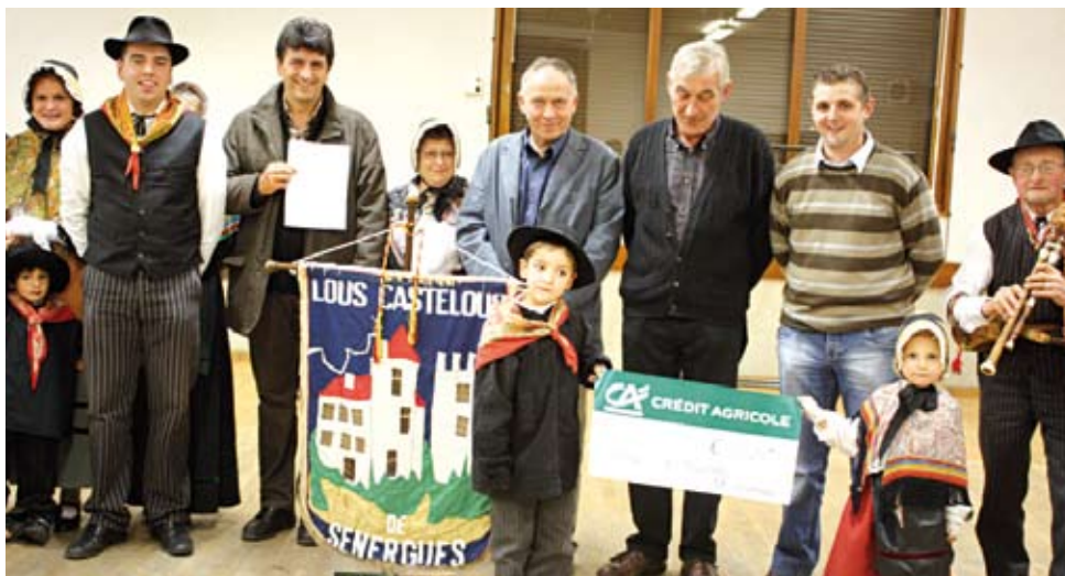
la remise des aides financières

La maison Druot a réalisé grâce à ces dons financiers, les nouveaux gilets, les pantalons et les blouses, les anciens étant usés par les années de représentations.