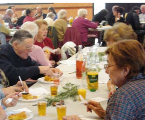
Le goûter des bénéficiaires à Lunel

Le bureau tient d'ailleurs à rappeler que l'arrivée de nouveaux licenciés reste une priorité pour le devenir du club et qu'il est possible (et conseillé) à tous de rejoindre le club : les néophytes qui le désirent peuvent bénéficier d'une formation proposée par les plus anciens ; il en est de même pour les enfants nés entre 1998 et 2002 qui peuvent s'inscrire à l'école de quilles (pour tous se renseigner et s'inscrire au siège, café Marragou).