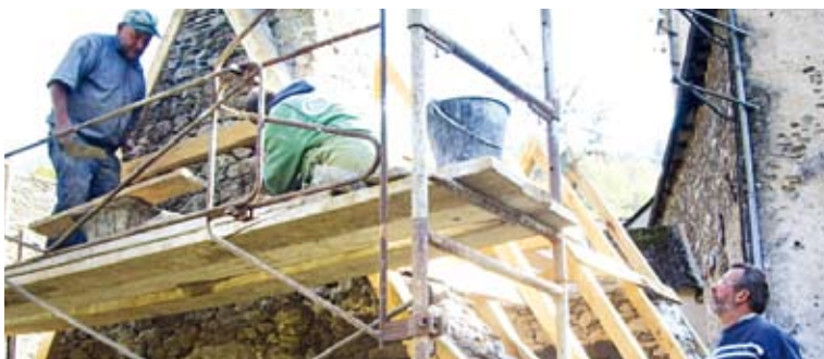
Des bénévoles de l'association à l'œuvre