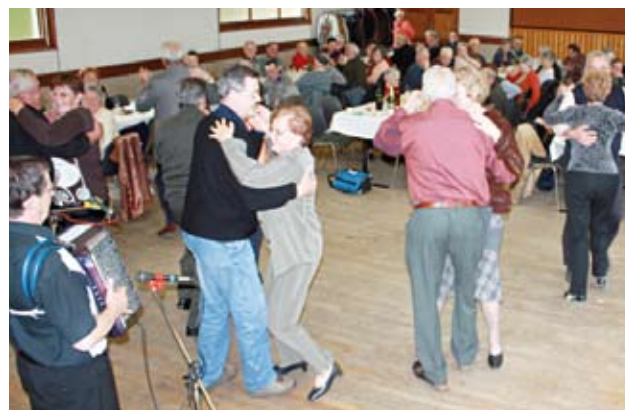
Le banquet de printemps